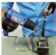
Termoencolhimento em Protetores de Cabos