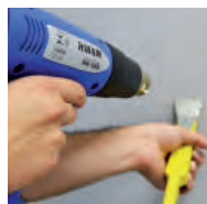
Secagem Rápida e Remoção de Tinta