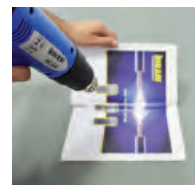
Aplicação e Remoção de Adesivos