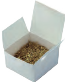
Caixa com 4000 grampos individuais.